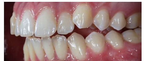
Laterale Ansicht links