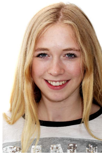
Frontal mit Lächeln