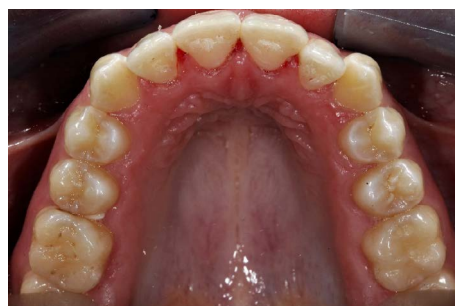
Oberkiefer okklusale Aufsicht

Bitte legen Sie den entsprechenden Fall in unserem Portal an und laden Sie dort die erforderlichen Bilder und das OPG hoch.