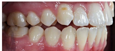
Laterale Ansicht rechts