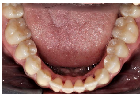
Unterkiefer okklusale Aufsicht