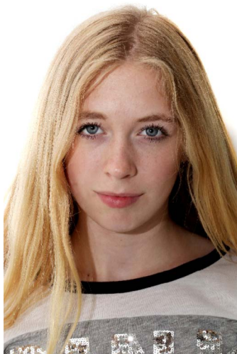
Frontal ohne Lächeln